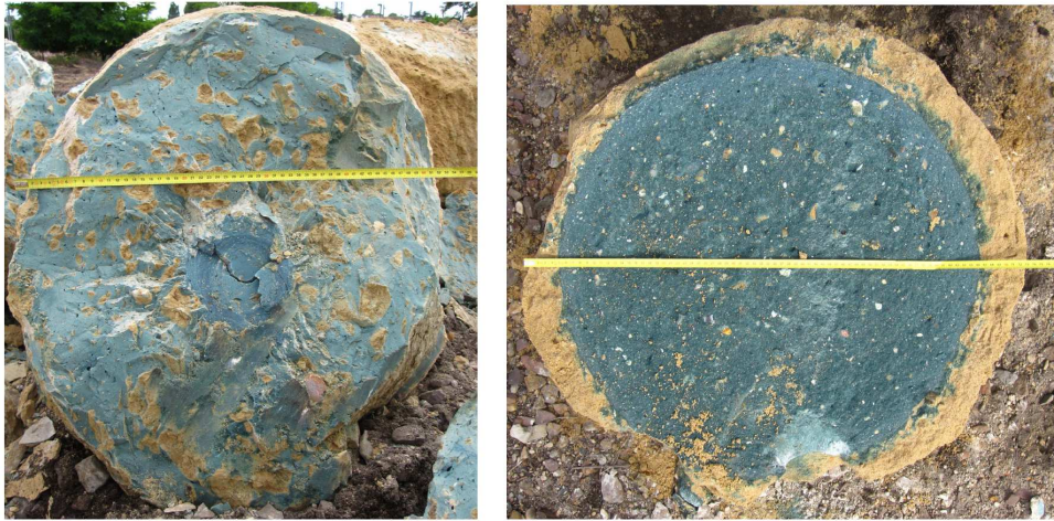
Figure 1. Sections des colonnes excavées (gauche) dans les limons et (droite) dans les sables.