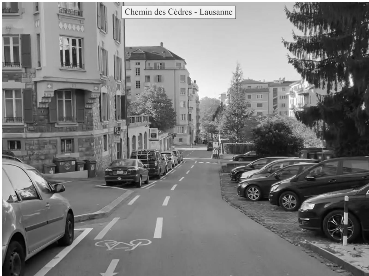
Figure 3 : L'insertion matérielle du double-sens cyclable à Lausanne prend différentes formes. Sur l'exemple du haut, on trouve par exemple peu d'équipements accompagnant le double-sens cyclable, aucun marquage séparateur entre les modes, un revêtement pavé pour les cyclistes, une chaussée où tous les usagers sont au même niveau et une faible présence de stationnements. Sur l'exemple du bas, une bande cyclable large a été réalisée tout le long de la rue, les intersections d'accès ont été aménagées à l'aide d'îlots séparateurs, des trottoirs traversants et des ralentisseurs ont été mis en place pour réduire la vitesse des usagers motorisés