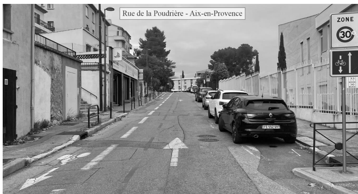
Figure 1, Double-sens cyclable à Aix-en-Provence

Depuis quelques années, on observe un retour du vélo dans le centre des grandes agglomérations (Lardellier, 2021; Ravalet & Bussiere, 2012; Richer & Rabaud, 2019; Adam et al., 2023). Cette croissance du vélo s'accompagne d'un réaménagement des espaces publics afin de mieux partager l'espace de circulation entre les différents modes. Pour encourager la pratique du vélo, les collectivités s'appuient notamment sur la mise en place d'aménagements cyclables : pistes et bandes cyclables, voies mixtes bus-vélos, etc. Parmi eux, figure le double-sens cyclable. Couramment appelé « contre-sens cyclable », le double-sens cyclable est une rue à double-sens dont un sens est exclusivement réservé aux cyclistes (Certu, 2009).