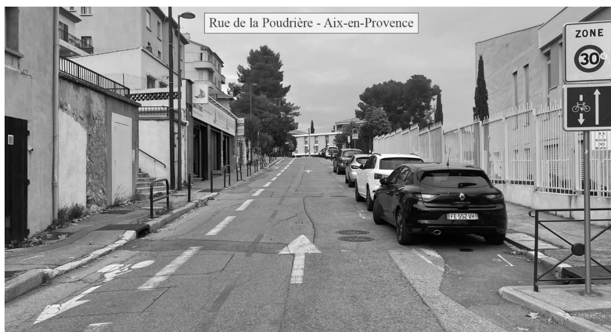
Figure 1, Double-sens cyclable à Aix-en-Provence

Depuis quelques années, on observe un retour du vélo dans le centre des grandes agglomérations (Lardellier, 2021; Ravalet & Bussiere, 2012; Richer & Rabaud, 2019; Adam et al., 2023). Cette croissance du vélo s'accompagne d'un réaménagement des espaces publics afin de mieux partager l'espace de circulation entre les différents modes. Pour encourager la pratique du vélo, les collectivités s'appuient notamment sur la mise en place d'aménagements cyclables : pistes et bandes cyclables, voies mixtes bus-vélos, etc. Parmi eux, figure le double-sens cyclable. Couramment appelé « contre-sens cyclable », le double-sens cyclable est une rue à double-sens dont un sens est exclusivement réservé aux cyclistes (Certu, 2009).