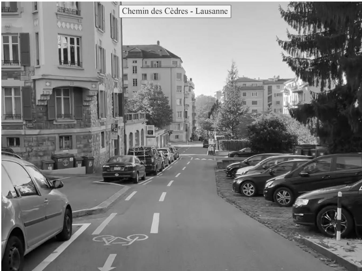
Figure 3 : L'insertion matérielle du double-sens cyclable à Lausanne prend différentes formes. Sur l'exemple du haut, on trouve par exemple peu d'équipements accompagnant le double-sens cyclable, aucun marquage séparateur entre les modes, un revêtement pavé pour les cyclistes, une chaussée où tous les usagers sont au même niveau et une faible présence de stationnements. Sur l'exemple du bas, une bande cyclable large a été réalisée tout le long de la rue, les intersections d'accès ont été aménagées à l'aide d'îlots séparateurs, des trottoirs traversants et des ralentisseurs ont été mis en place pour réduire la vitesse des usagers motorisés