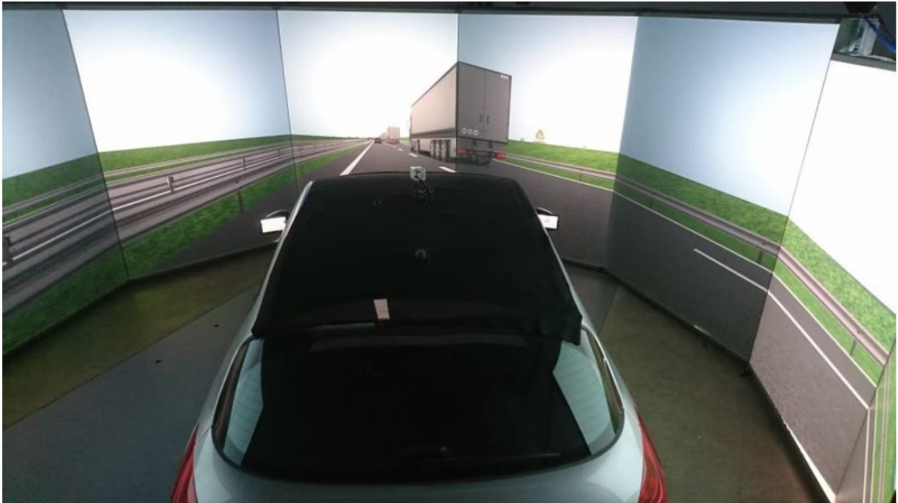
Figure 2: Simulateur de conduite, utilisé dans le cadre de ces travaux. Extrait de Jallais, C., Vincent, F., Hoarau, A., Moreau, F., Ndiaye, D., Mascalchi, E., Tattegrain, H. Simulator study on platooning and other road users (2022) D4.7 of H2020 project ENSEMBLE.

Les pelotons de camions devraient être développés particulièrement sur autoroute, infrastructures autorisant des vitesses élevées et à forte demande cognitive du fait de la prise de décision rapide. Par exemple, lors d'un dépassement ou d'une sortie d'autoroute, il semble que la plupart des conducteurs de véhicules légers adoptent un comportement sécuritaire en respectant la limite de vitesse et/ou en attendant derrière le peloton. Ce comportement sécuritaire pourrait tout de même avoir un impact sur la fluidité du trafic. En revanche, lors de l'entrée sur l'autoroute, les résultats indiquent que les conducteurs n'attendent pas que le peloton soit passé, surtout lorsque le peloton est relativement long (7 camions), et s'insèrent au sein du platoon , obligeant celui-ci à se dissoudre. Dans cette situation, il a été observé que les conducteurs s'intercalent entre les camions en évitant de trop réduire leur vitesse, mais avec une vitesse d'insertion inférieure à celle du peloton. A noter que les systèmes de sécurité (e.g., Adaptive Cruise Control, détection obstacle) devraient être en mesure de détecter un véhicule qui s'intercale et ainsi éviter les situations dangereuses.