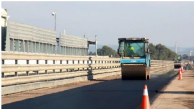
Figure 3: Préparation de la chaussée du circuit test à IDIADA. Extrait de Leiva-Padilla, P., Schmidt, F. (2022). Assessment of platoon axle loads on road infrastructure. D4.1 of H2020 project ENSEMBLE.

En ce qui concerne les chaussées, l'étude a montré que sans mesures particulières, les platoons peuvent entraîner une diminution de la durée de vie de la structure de chaussée étudiée pouvant aller jusqu'à 37%, pour des camions roulant à 80 km/h. L'impact des platoons s'avère plus important pour des températures élevées (supérieures à 20 °C), pour lesquelles la rigidité des matériaux bitumineux diminue. Néanmoins, on a également mis en évidence qu'il est possible d'adapter les caractéristiques du platoon , telles que le nombre de poids lourds, la charge, la position latérale, afin d'optimiser l'endommagement induit, en fonction du tonnage de marchandises transportées. Imposer une variation des positions latérales des véhicules, en particulier, permet d'éviter l'effet d'un trafic trop canalisé, et de réduire l'endommagement des chaussées.